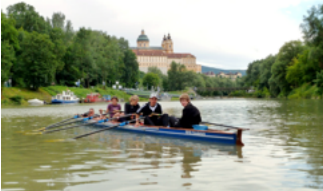
AUF DER DONAU

In den letzten Jahren waren die Weser, Lahn und Donau unsere Fahrgewässer. Voraussetzung für eine Teilnahme an diesen Fahrten ist eine regelmäßige Anwesenheit am Kanal.