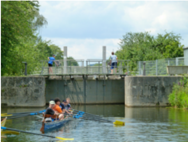
AUF DER LAHN