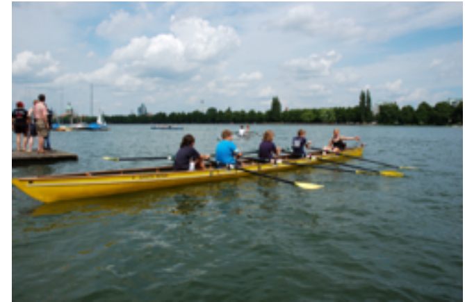
AUF DEM MASCHSEE IN HANNOVER

Mehr Informationen unter www.GSG-RUDERN.de